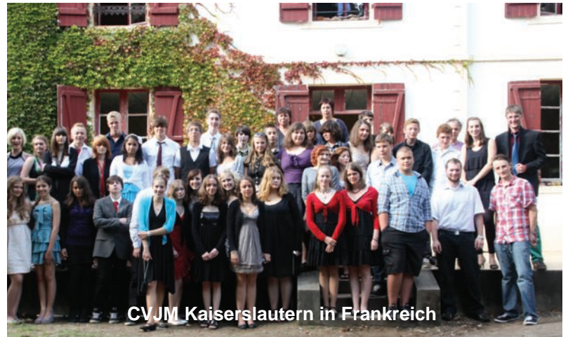
CVJM Kaiserslautern in Frankreich