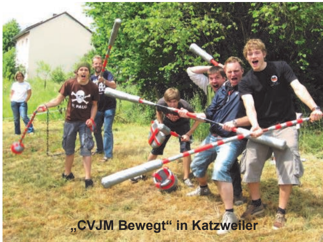
„CVJM Bewegt“ in Katzweiler