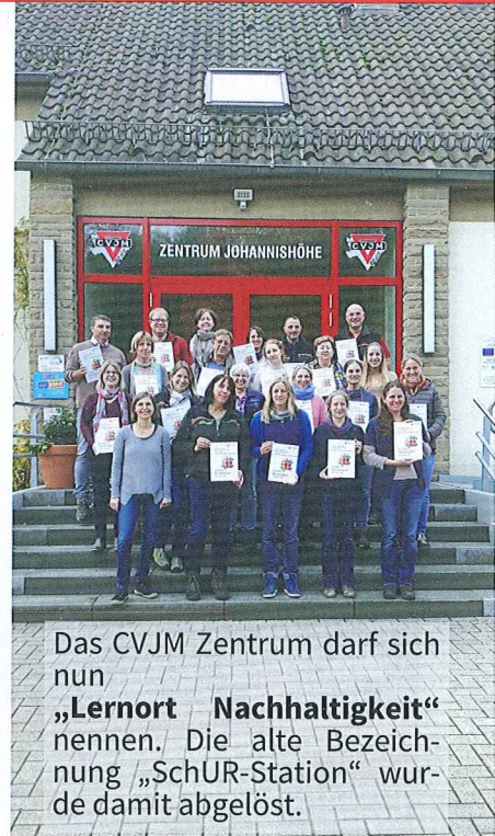
Das CVJM Zentrum darf sich nun „Lernort Nachhaltigkeit“ nennen. Die alte Bezeichnung „SchUR-Station“ wurde damit abgelöst.